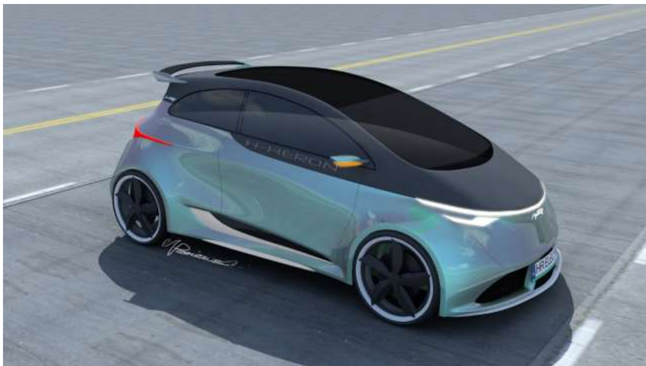
Źródło własne - Biomass Energy Project S.A . Projekt samochodu osobowego z napędem elektrycznym dla Heron Electric S.A