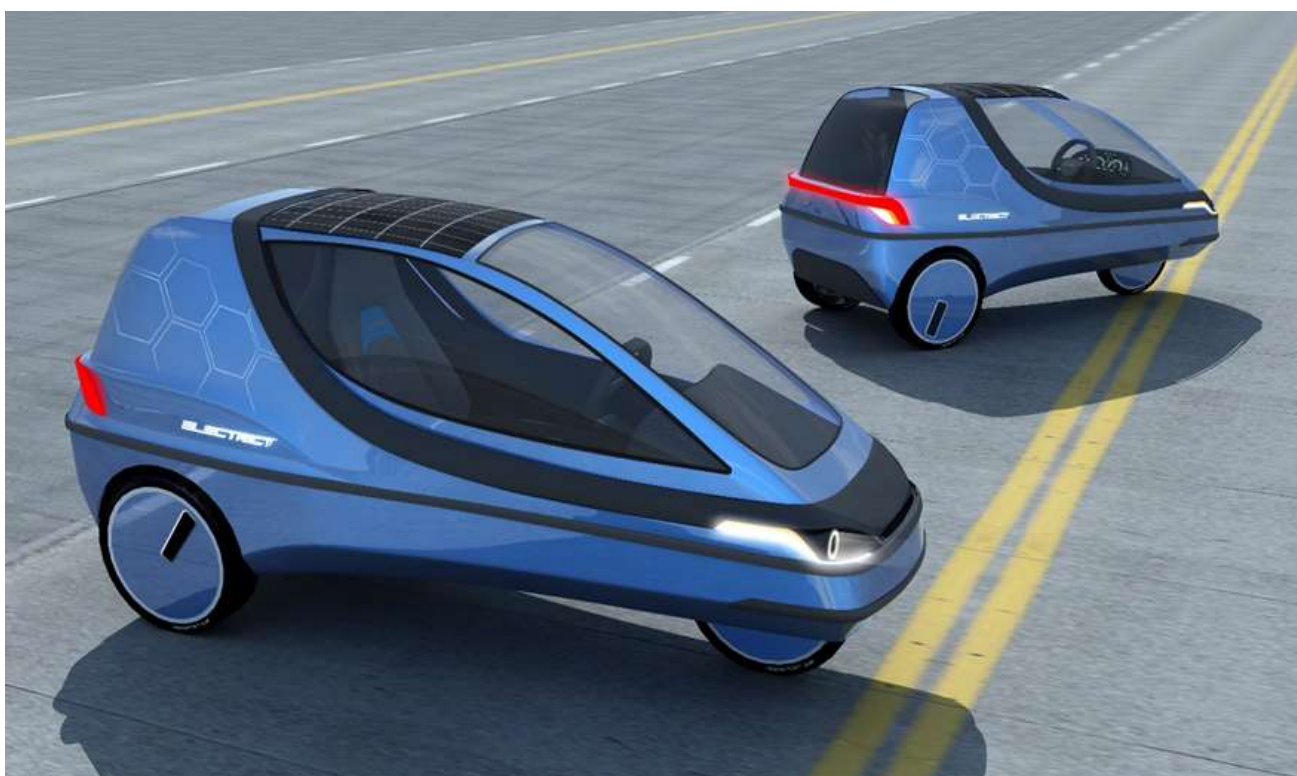
Źródło własne - Biomass Energy Project S.A.. Projekt modernizacji trójkołowego pojazdu elektrycznego dla Hoverjet i Heron Electric