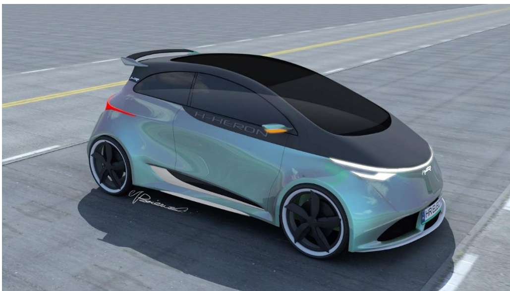
Źródło własne - Biomass Energy Project S.A . Projekt samochodu osobowego z napędem elektrycznym dla Heron Electric S.