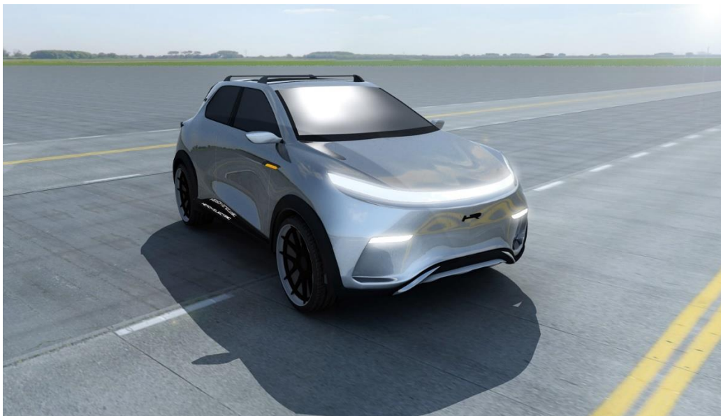
Projekt SUV-a z napędem elektrycznym